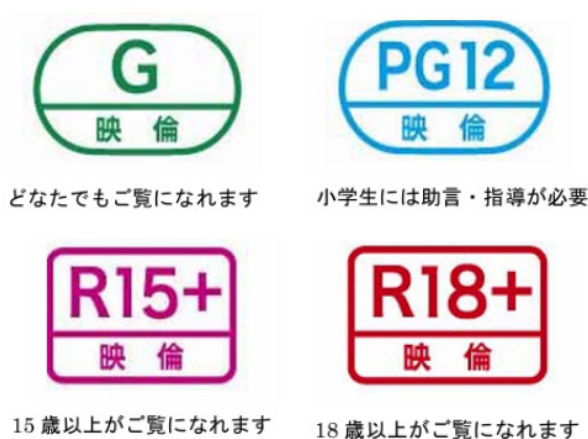
图2 日本电影分级标识 [13]