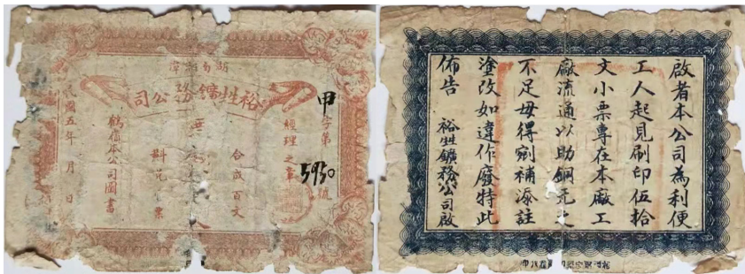
图5. 1916年, 湖南湘潭裕牲矿务公司发行的面值为50文的票钱正面与背面(来源:《略论清代、民国时期湘潭地方金融货币》, 微信公众号“湘潭艺术收藏”, 2021-12-03)