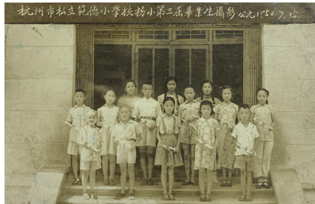
图11. 1950年7月,范德小学初小第三届毕业生摄影

其校舍卍字草堂在1958年“大跃进”时期被拆除。如今，卍字草堂的地基，与位于仁寿山的另外两处尚存的民国建筑——灵隐路3号的林风眠故居、玉泉路1号的蔡元培之女蔡威廉及女婿林文铮旧居“马岭山房”，述说着20世纪二三十年代杭州西湖与当时中国画坛的故事和自修成才的卢鸿沧所具有的“宁波帮”之精神气质。