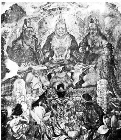
图9. 西方极乐世界图第一幅

1925年夏，陈晓江完成了这11幅大幅壁画（图9），曾运到各地展览，并影印成册出售。曾参与1895年“公车上书”、筑居杭州西湖小南湖的廉泉（1868—1931，字惠卿，号扁笑，又号南湖居士、小万柳居士等）观看陈氏“西方极乐世界图”壁画后，特集