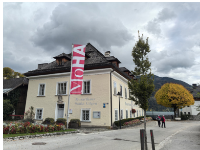
图 10. 莫扎特故居

年厚重历史的盐都。早在公元前2000年末期，古老的凯尔特人便在此开采被誉为“白金”的山盐，使这里变为“世界最古老的盐都”。盐矿的开采为皇室带来了巨大财富，也支撑着哈镇的兴建与发展。清澈透底的湖水，像一条宽阔的绿色绸带，飘扬在群山怀抱中，湖岸点缀着层层叠叠、色彩斑斓的童话木屋。无论春夏秋冬，这里都美艳惊人。镇中最瞩目的标志，是建于1785年的新教教堂，哥特式的尖顶耸入云霄，无论在哪个角落，总能与湖光山色构成绝美的画面。1997年，哈镇因其独特的文化景观，被联合国教科文组织列入世界文化遗产名录。小镇的湖畔仙境，帧帧如画，贴着险峻的斜坡与宁静的湖泊，宛如一幅来自天堂的明信片，将湖光山色的自然之美与厚重悠久的人文历史完美融合，吸引着全世界追寻童话与宁静的旅人。哈镇更像一个依山面湖的村庄，居民仅有八百至一千。由于地处悬崖与湖泊之间，土地极为珍贵，这催生了哈尔施塔特一项惊世骇俗的独特习俗。据说镇上逝去的人埋葬十年后，骸骨便被移出坟墓，安置于半山腰的人骨教堂（骸骨馆）中。这些头骨被清洗后，绘上优雅的装饰纹样、十字架或玫