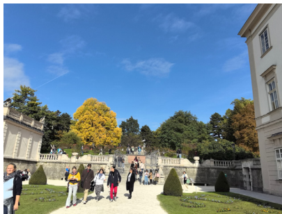
图 16. 萨尔茨堡中文学校

周六周日的教室，是声音的博物馆。稚嫩的朗读声，是尚未雕刻的玉石。老师的领读，是沉稳的引路灯塔。偶尔的欢笑，是溢出的透明的糖。黑板上，一个方字就是一个世界。你问孩子，他们会说，“家”字有温暖的屋顶，“江”字有奔腾的水流。孩子们小心翼翼地临摹，像把散落的星斗接回自己的银河。走廊的风，吹动着墙上的中国结。那抹鲜红，系住了飘洋的风，过海的云，也系住了童子们脑海里祖籍国文化的清晰倒影。