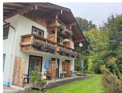
图 14. 阿尔卑斯山居

门,月光下的阿尔卑斯在柔和地呼吸,整座山随着星群的明暗微微起伏。我关上窗,这个夜晚,最适合读吴先生翻译的那本《1898年的夏日》。过去一年来的奔波,在我脑海翻腾。我突然明白,什么叫山居?就是把自己活成一处风景,让云雾应我之邀随时来访,让寂静在此定居,也让每一次呼吸都化为我与群峰的和睦联笑。