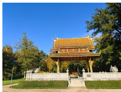
图 19. 晨游法兰克福公园辄见暹罗宫