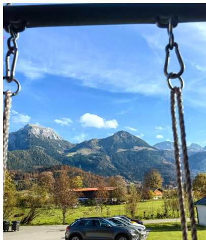
图 26. 初秋羁旅边镇