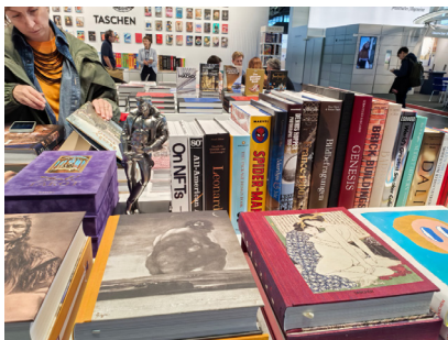
图 20. 法兰克福国际书展

踏进那个巨大的展厅时，翻动纸页的沙沙声，像秋日穿过林间的风。不同语言的低声交谈，汇成一条意识流之河，讲述着某个遥远大陆的故事。眼睛睁开，可以慢慢辨认出无边无际的以文字砌成的峭壁与峡谷。德语的严谨瘦长，法语的优雅圆润，阿拉伯语如舞蹈般的曲线，中文方块的稳重端庄。每一种字体，都是一扇门，通往一个民族最深的梦境。空气里浮动着油墨、胶水和旧纸张的混合气味，那是一种奇特的知识体味。人们伸出手，指尖拂过书的脊背。此刻，手下这些纸张，便是光亮的