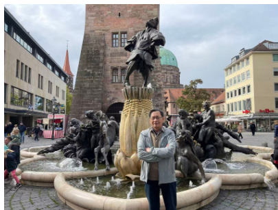
图 25. 纽伦堡一瞥