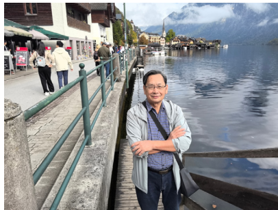
图 12. “欧洲最美小镇”哈尔施塔特（其 2）