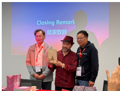
图 21. 法兰克福雪漠书会

翻开雪漠的书，像独自踏入语言的旷野。他写西部，但穿过地理的帷幕，他其实写的是人在极限境遇里如何站