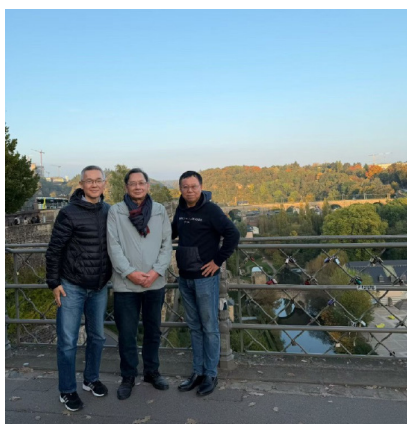
图 17. 卢森堡漫步

桃源，乃转与西方阵营缔盟；及至申根既成，欧元通行，遂成欧罗巴腹心之势；于今法德卢三语并驰，堪称奇观。卢语主宰市井谈吐，气势盎然。于是登高望远，古堡星罗岩谷，雉堞隐现霞霏。卢国谓千堡之国，岂虚誉哉！但见虹桥入云，横跨深涧。凌霄教堂，映日九重。峡谷万仞，苍崖若削，紫气雄浑，幽涧生晖。朝暮钟声，斜穿林樾。他日春来，紫藤绕垒。眼下秋至，红叶雕楼。更有吴严诸君在侧，唇舌生津，详解古今，令人流连，仿返中世。嗟乎！弹丸之地，千年鼎革，三语齐驱，世道存真。陡崖锁钥，时运勃兴。市井风情，融通大道。古堡残照，尤显刚柔。于此之际，百代苍茫之感，能不油然而生！人立于世，不过白驹过隙。大丈夫之途，岂能尽如人意乎！