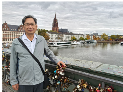
图 23. 美茵河感事

美茵河的秋，爽得清朗。远处有一层薄雾，河水懒懒地映着蓝天，把对岸教堂的尖塔揉成晃动而模糊的倒影，像一封被水渍浸湿的中世纪旧信，字迹在波光里慢慢展开。岸边的悬铃木醒得透彻，一树一树的火焰，黄得凛冽，艳得夸张。金色里藏着绛红与赭褐，像是火焰燃后的余烬，华丽里透着沉沉的倦意。风从河面来，带着水气，凉进衣领。风拂过时，叶子簌簌落下，默默地扮作风吹过时的配角，一片又一片，最终安静地铺在石板路上，软软的一层，踩上去不发声，让一种蓬松的温柔，浸染着东土大唐来客的驿旅之心。空气里的清冽，显得格外迢远，像温暖的承诺，让驿客一时不知道走到那里。是的，秋天午后的阳光十分吝啬，但一旦从厚重的云隙里漏下些许，便可化成最温柔的笔触。不一会儿，云合拢了，世界复归于柔和和宁静，斜斜地照在教堂古老的石墙上，墙上的藤蔓叶子顷刻透明起来，照在河面上，那片灰蒙蒙的水就活了，碎成万千片粼粼金箔，随着水波微微颤抖。于是来客看懂了，美茵河的秋色，不单是眼睛看到的，而是脚底落叶的无声触感，是鼻尖上清冷微甜的气息。它用最绚烂的颜色，说着关于凋零与告别的话。这条古老的河，见惯了数百数千个这样的秋。它用无声的流淌告诉游子：谢幕，可以如此庄严，可以如此美丽，不用喧哗。