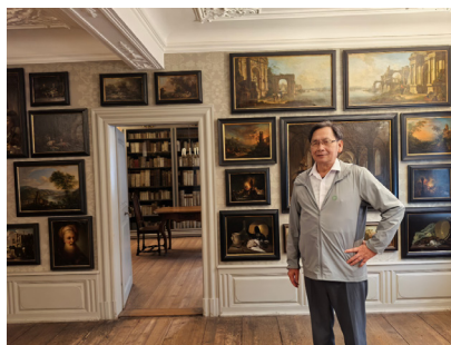
图 24. 歌德故居

路是旧的，足迹叠着足迹，蜿蜒前行，走进一片金与绿的交染地带，让呼吸和着远处溪涧的呜咽。空气清新，吸进肺叶，有如一股清澈的凛冽。阳光足够慷慨，拨去疏朗的枝桠，筛下片片晃动而温暖的光斑，落在苔藓上。这光仿佛被季节滤过，失去了盛夏的蛮横与雪亮，变得无比醇和，憨厚地涂在每一片转黄的叶子上。枫叶应时燃起绯红，紧贴黝黑的岩石，那样孤绝，那样义无反顾。石缝间的野草顶尖，透着干枯的赭色，全然是一种不肯全盘认输的倔强。那几株孤零的落叶松，针叶稀疏，簌簌地落下，树身笔直，像一柄柄褪绣的向天祈求