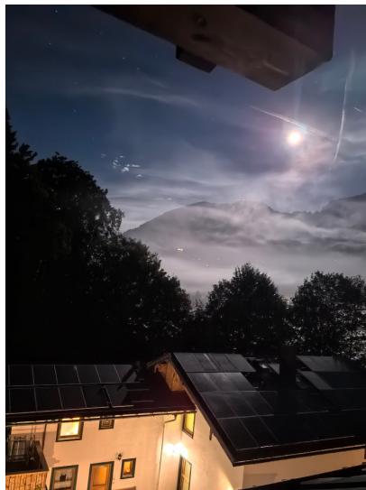
图6. 阿尔卑斯山秋月

沿着高低不平的沙石栈道往里走，两旁的杉树靠边站着，给人礼让出一条凸路。忽然一个转弯，后湖就毫无预警地摊开在眼前。这时候我必须怔住：那是一种怎样的蓝啊？像是谁把一整块巨大的温润琉璃，静静地嵌在山谷的怀抱里。水，透明得可以看见底下朽木的纹理，一截一截，沉睡着，想是在复习着它们曾是前世林木时的梦境。湖水极致的清透，湖底赭红的岩石，墨绿的水草，都成了调色板上的构料，与天光云影一一调和，泛出不可思议的孔雀蓝、松石绿、薄荷青……一丝一丝，一缕一缕，在视野里融融漾开，又默默沉淀。阳光还没完全照进来，这颜色略带些许凉意，像一块生寒的玉。真不愧是“盐带的九寨沟”啊。心里刚情不自禁地浮起这句赞叹，又觉得唐突了。中国九寨沟的瑰丽是璀璨的、奔放的，像一卷浓墨重彩的唐卡；后湖的美，却是收敛的、沉思的，更像一幅笔意清冷的小