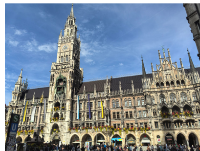
图4 玛丽恩广场市政厅