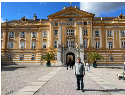
图 30. 梅尔克修道院

良辰美景摇晴日， 乐事赏心飞画舟。 金箔垂窗思往昔， 丹青溯古数春秋。 长廊倚柱窥黄卷， 千载烟云眼底收。