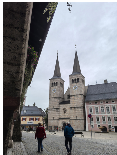
图9. 巴特赖兴哈尔小镇

巴伐利亚州与奥地利萨尔茨堡州交界处，阿尔卑斯山北麓的褶皱里，藏着一个巴特赖兴哈尔小镇。它被青翠的山峦温柔环抱，有河穿镇而过，水面总映着彩墙与雪峰的影子。小镇宁静而深厚，如窖藏的陈酿，其奥秘早在两千年前便已深埋地下。那是阿尔卑斯山区最古老也最珍贵的宝藏——盐。罗马军团的鹰旗曾在此飘扬。公元一世纪，勘探者便已在此汲卤取盐，铺设道路，将“白色黄金”运往四方。盐泉，是