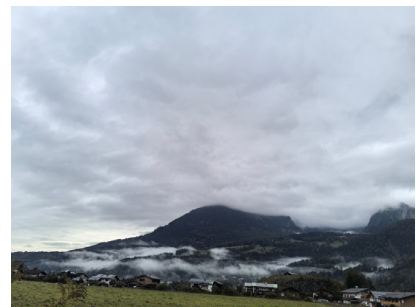
图1. 维也纳萨尔茨堡路上

地狭人稀千百旋， 层层绿野接云端。 侧观古堡城中寂， 横望长湖陆上宽。 电掣风驰心有梦，