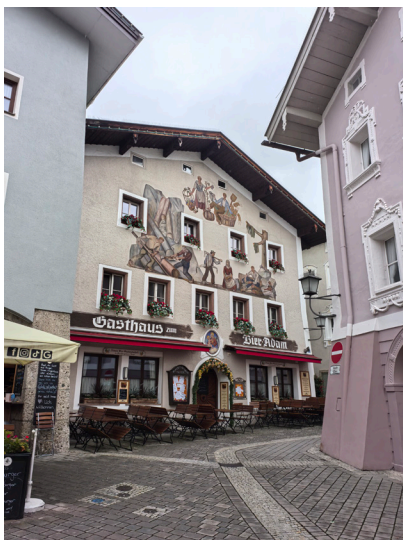
图2 路过盐城萨尔茨堡

暮色像融化的蜂蜜，缓缓涂满阿尔斯山高高的雪脊，像夕照中泛开的蔷薇。铁锅里的奶酪在咕嘟着，雾里挟着奶香，与人呼出的白气缠绕升腾。蜡烛在玻璃罩里轻轻摇曳，满堂笑语融化在温热的葡萄酒里。举杯时，雪峰顿时成了青灰色的剪影。火光在每张笑脸上跳动，显得尤为精神焕发。只是火光中，眼底都映成了琥珀色。此刻的温暖，是轻碰酒杯时相触的指尖，是分享牛排和面包时交汇的眼神。我们在火的圆周里，用简单的食物与笑语，构筑起一个比岩石更坚实的夜晚。清冽的香气倏然腾起，与雪山的气息悄然会意。这簇火终将熄灭，但经此一聚，我们都想成