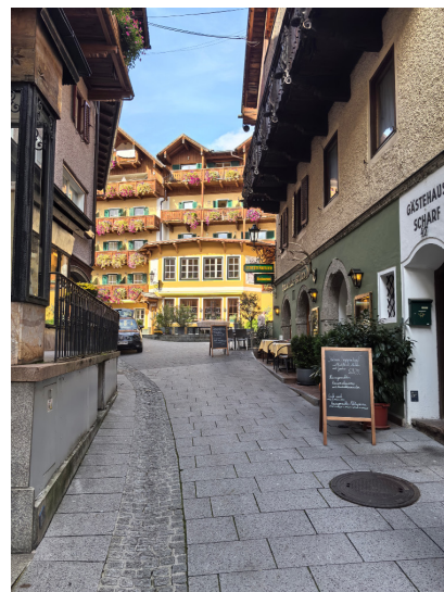
图 13. 白马酒店

木屋是松木的。推开窗,先是松脂的苦香,接着才是刚从雪线小跑下来的风,想是因我而至,略带着少许冰的锋利与草的柔软。晨雾在撤退,退到半山停住,化作腰间的云带。忽然我明白,晨雾也因我的到来在演一场矜持的快闪。我第一次来到阿尔卑斯,背着空空的行囊,“那他乡的云,那他乡的风,为我抹去忧伤”。此来我只为看一眼高山下那个九寨式的湖泊,看一眼山峦的雾,山峦的月。阳光也甚是配合。到正午,太阳满是笑靥,把一切都照得通亮。于是我开始煮茶,算是一种山居客的经典礼仪,用你的静默交换我的静心。下午关窗时,我看见对面山崖上的鹰巢,黑得如同一滴凝固的夜。吴先生告诉我,那是世人无所不知的那个发动过二战的恶棍曾经的魔巢。我睡不着,推开