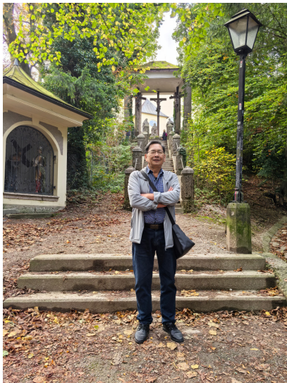
图 15. 盐堡怀古

这个地名起得有趣——“盐城萨尔茨堡”。看到盐堡，我便想起欧洲中世纪那些举着火把深入矿洞的采盐人，只是“俱往矣，数风流人物，还看今朝”。此刻，我正站在萨尔茨堡的盐溪边。这里没有真正的盐矿，只有一条被当地人称为“盐溪”的小河，因古代运盐而得名。水是淡的，也许是心理反应，我总觉得飘泛出一点咸味。对岸的仿欧式建筑在暮色中静默，尖顶的轮廓，让人想起萨尔茨堡要塞曾经烽火连天的岁月，曾经金戈铁马的剪影。盐，总是沉睡在阿尔卑斯山的岩层中，开采出来后，被装进威尼斯商船上的橡木桶，运到法兰克福的集市，搬进维也纳的厨房，然后在无数个家庭的陶罐里，履行着改变食