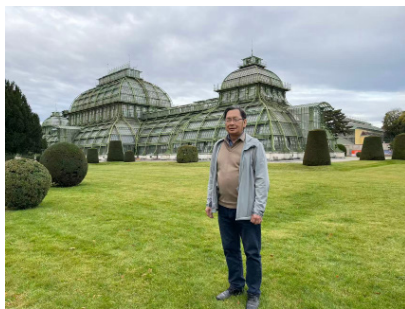
图 31. 维也纳美泉宫

跨过奥匈帝国时代皇廷美泉宫的镀金门槛，仿佛踏入了时空的褶皱。吱呀响的拼花地板，声音幽微，像是数百年前少女们裙裾曳地的微微颤动。空气里浮动古蜡古木与时光混合的醇厚气息。洛可可式的厅堂，是那时最华丽的篇章。金漆卷草纹，在白色天花板上缠绕，如同永不醒来的旧梦。对我等炎皇子孙来说，想必最令人心神摇曳的，是宫廷中那些东方房间。据说推开中国厅的门，瞬间就如穿越了半个地球。紫檀木雕琢的屏风上，东方山水在异国宫廷蜿蜒；黑檀木镶嵌的橱柜，锁着来自明朝万历年间的彩瓷。上面的花枝莲纹，听说曾被北京紫禁城的日影映照过，不知何时来到万里之外的美泉宫。到今天，承担着给奥中友谊增添光彩的使命。