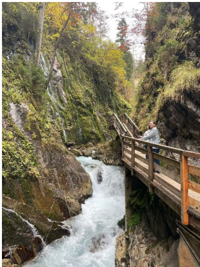
图 29. 深谷观瀑