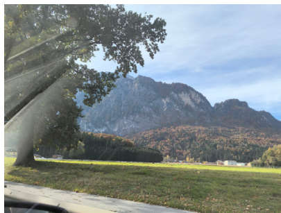
图 27. 登盐山（萨尔茨山）