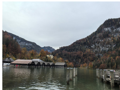
图 28. 国王湖感咏

德国东南有湖，名曰“国王”，位处贝希特斯加登之侧，横跨德奥之界，倚阿尔卑斯山之险，涵冰河纪之玄。周遭叠嶂如屏，环岸廿余里，群岫参差如列戟，波光敛滟胜倒影。云锁雾