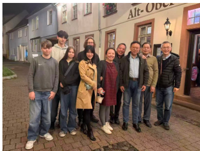
图 22. 格兰茨出版社晚聚

格兰茨社欢颜， 磊落群贤说暖寒。 呼吸鸿篇承雅韵， 巴黎爽剧唤韶年。 书香飘散云天外， 文脉昂扬山海间。 共话今宵思大业，