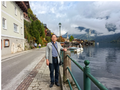
图 11. “欧洲最美小镇”哈尔施塔特（其 1）