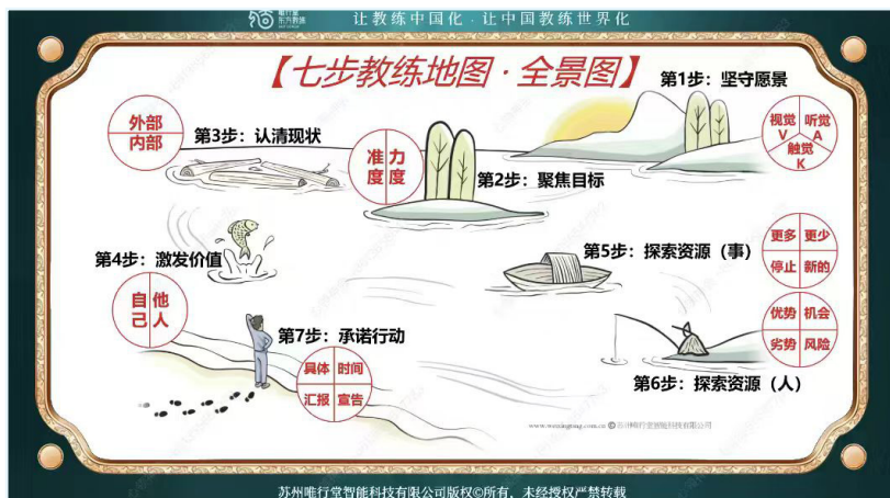
图2 东方教练“七步教练地图”